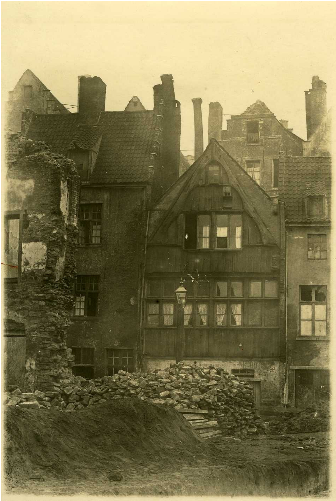
De kaalslag, circa 1884. Een houten huis aan de Palingbrug, dat weldra zal worden afgebroken.