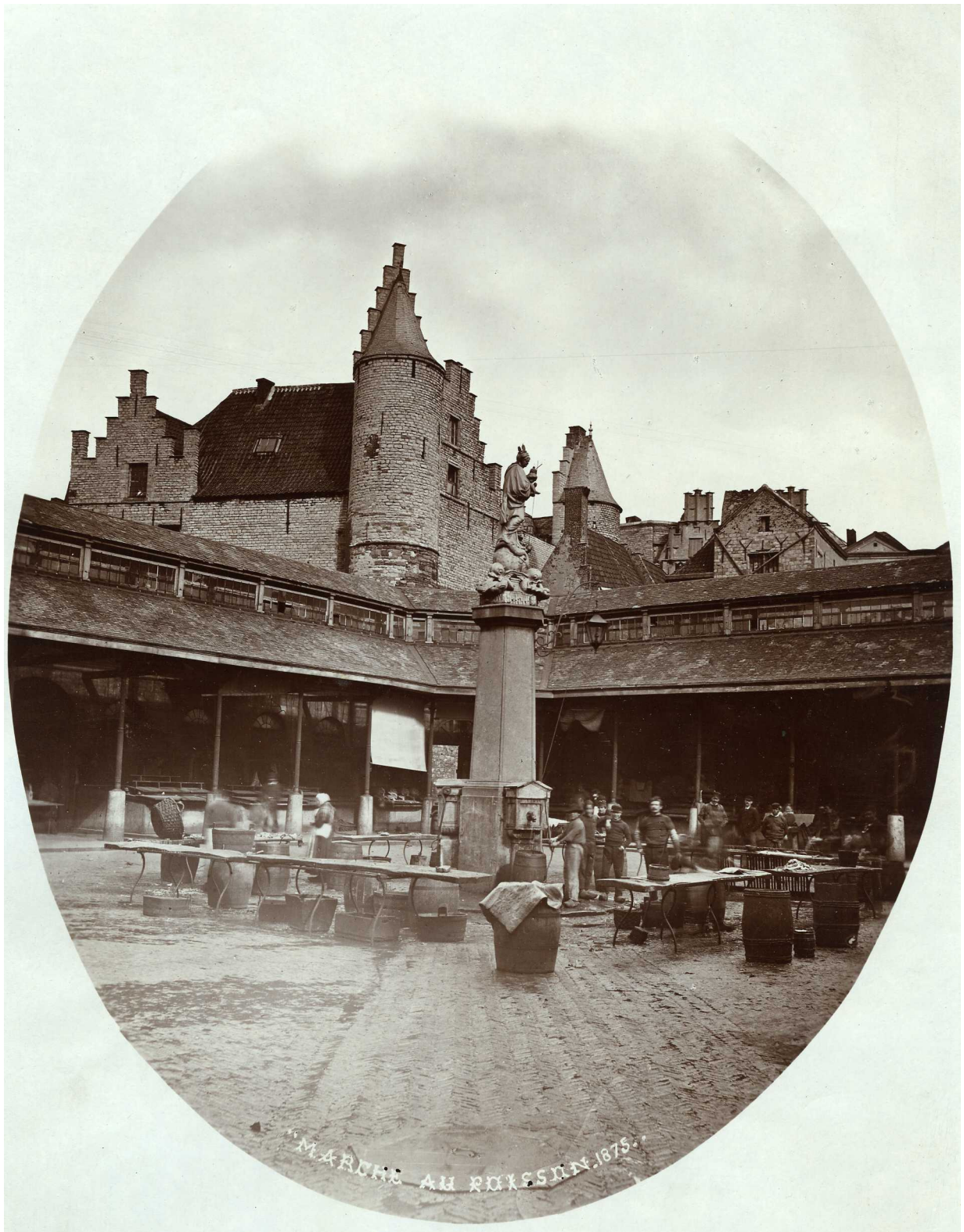
De Vismarkt aan het Steen. Een opname van Hugo Piéron, gedateerd 1875