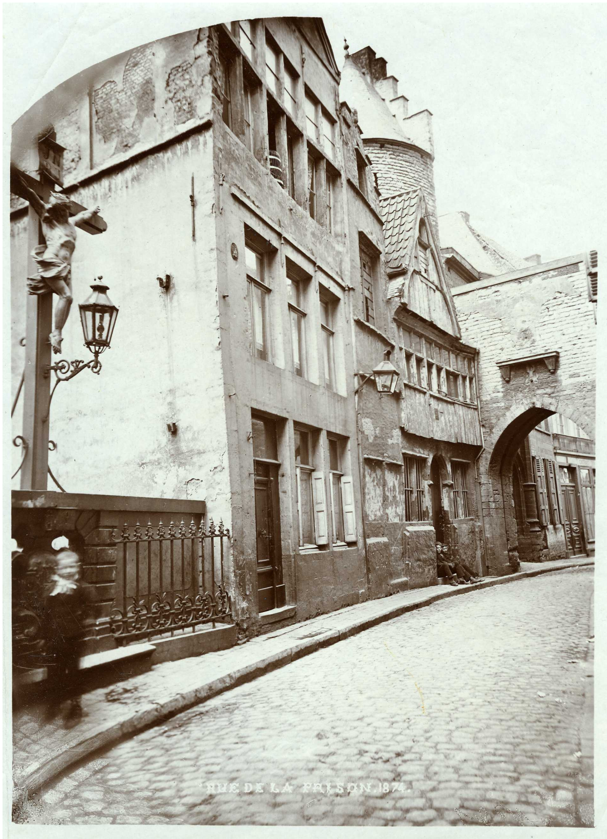
Gevangenisstraat en buitenzijde van het Steen. gedateerd 1874. Links de oude calvarie, met een uitzicht op de Vismarkt en de Schelde. Dwars onder deze straat loopt een andere straat, de Palingbrug, die uitgeeft op de Vismarkt