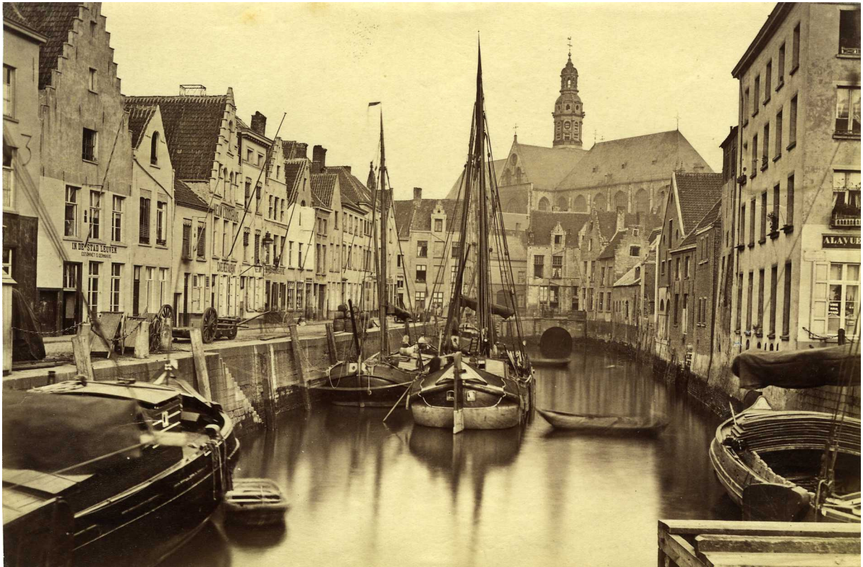
De Koolvliet.