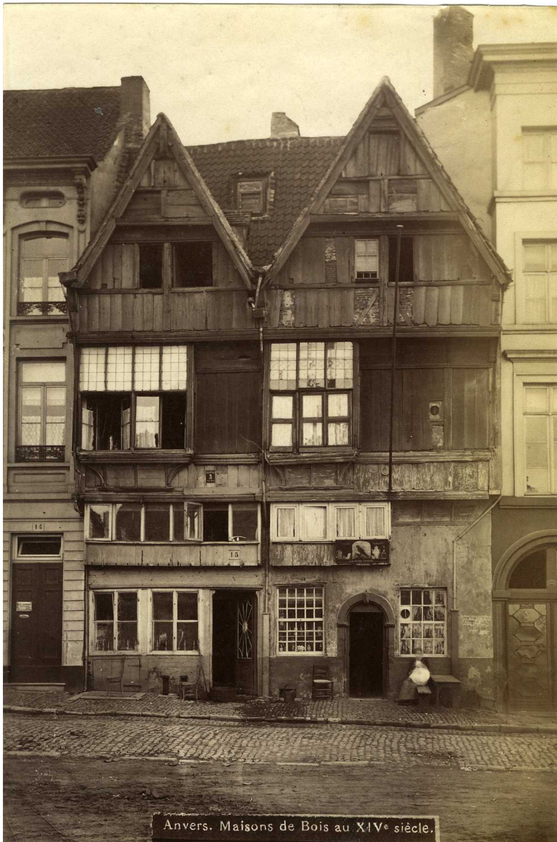
Houten huizen op het Sint-Walburgisplein. Fotograaf onbekend.