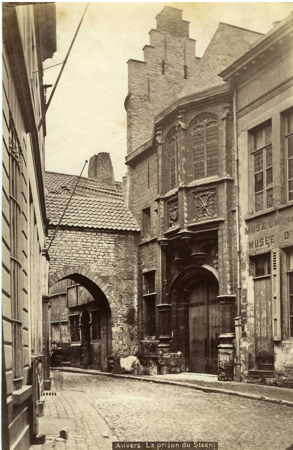
Anvers. La prison du Steen!