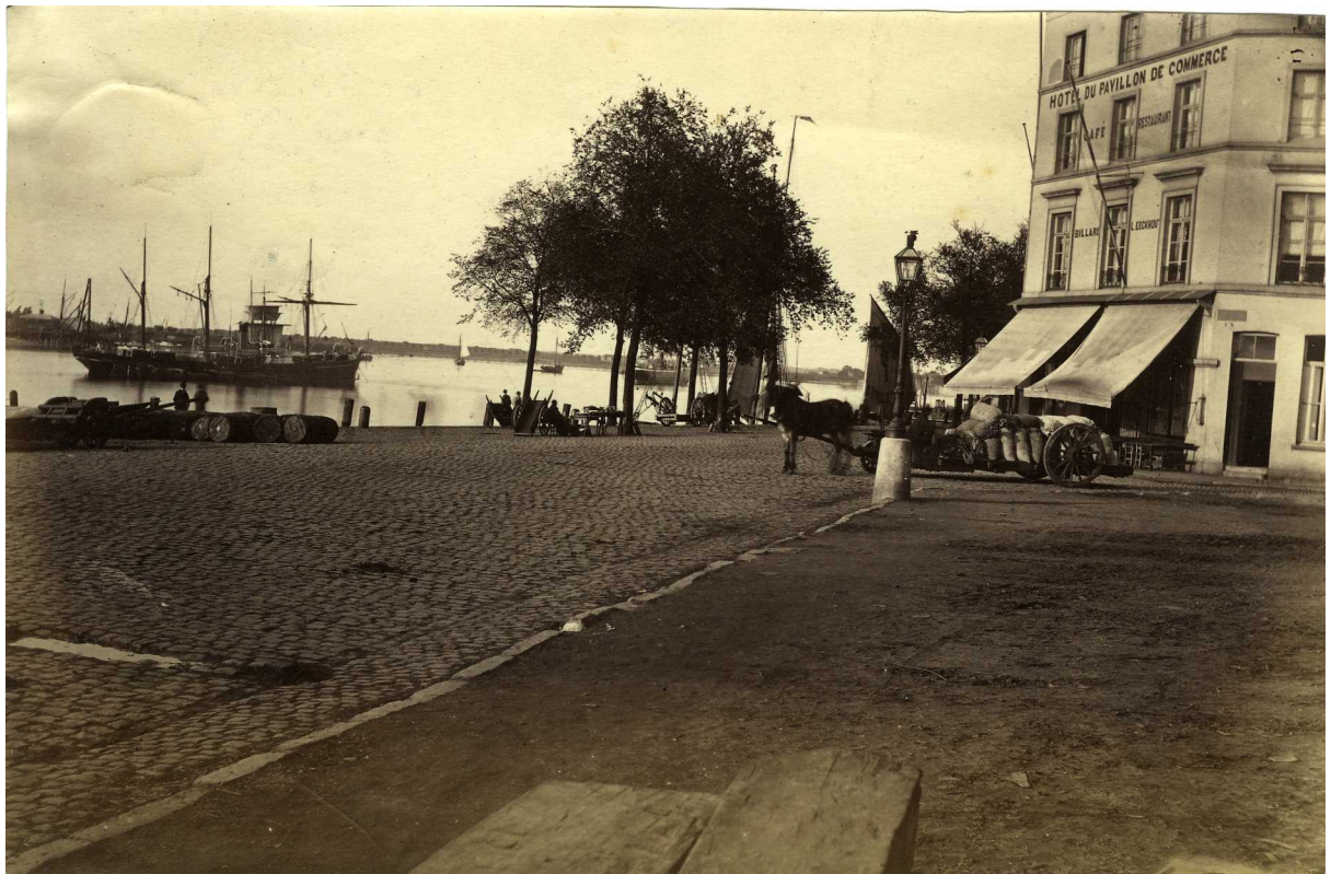
Het Sint-Walburgisplein, noordwaarts.