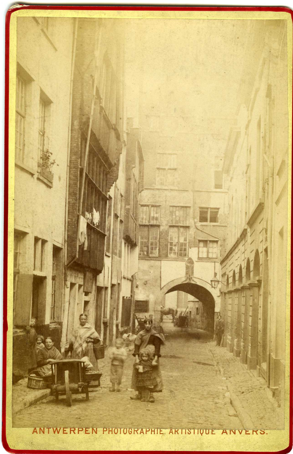
De palingbrug richting Schelde. Achteraan de overwelfde doorgang die onder de Gevangenisstraat doorloopt. Een foto van Egide Linnig