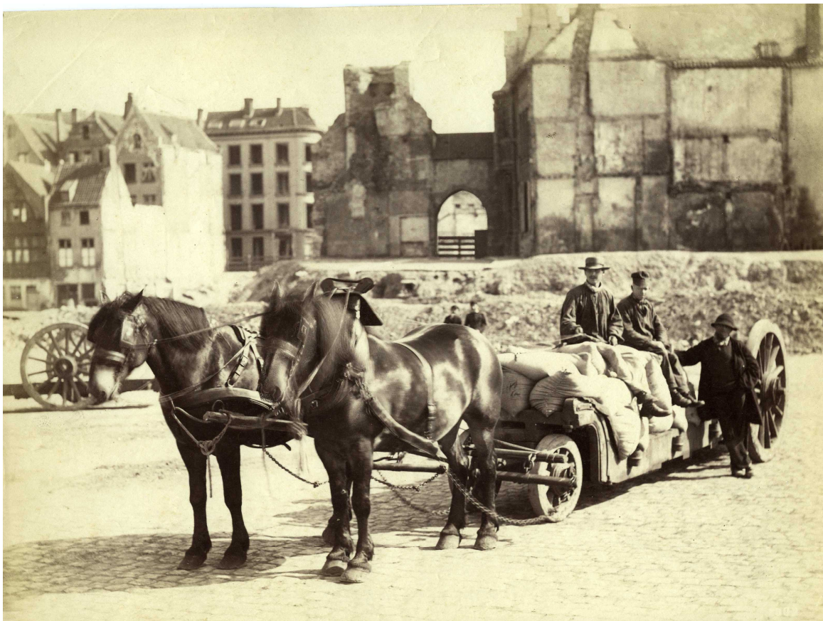
De kaalslag, circa 1884. We kijken vanuit het ontmantelde Sint-Walburgisplein naar de verdwenen Steenstraat en de binnenzijde van het Steen.