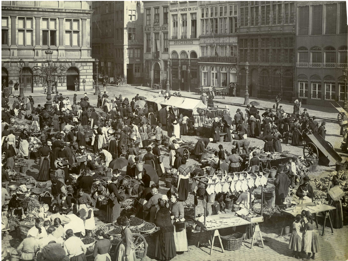
De aanwezigheid van de oude havenwijk en de overzetdienst naar het Waasland, maakte dat de Grote Markt zijn levendige groentemarkt had. Vooraan rechts gedroogde stokvis. Een foto van Hasse, jaren 1880