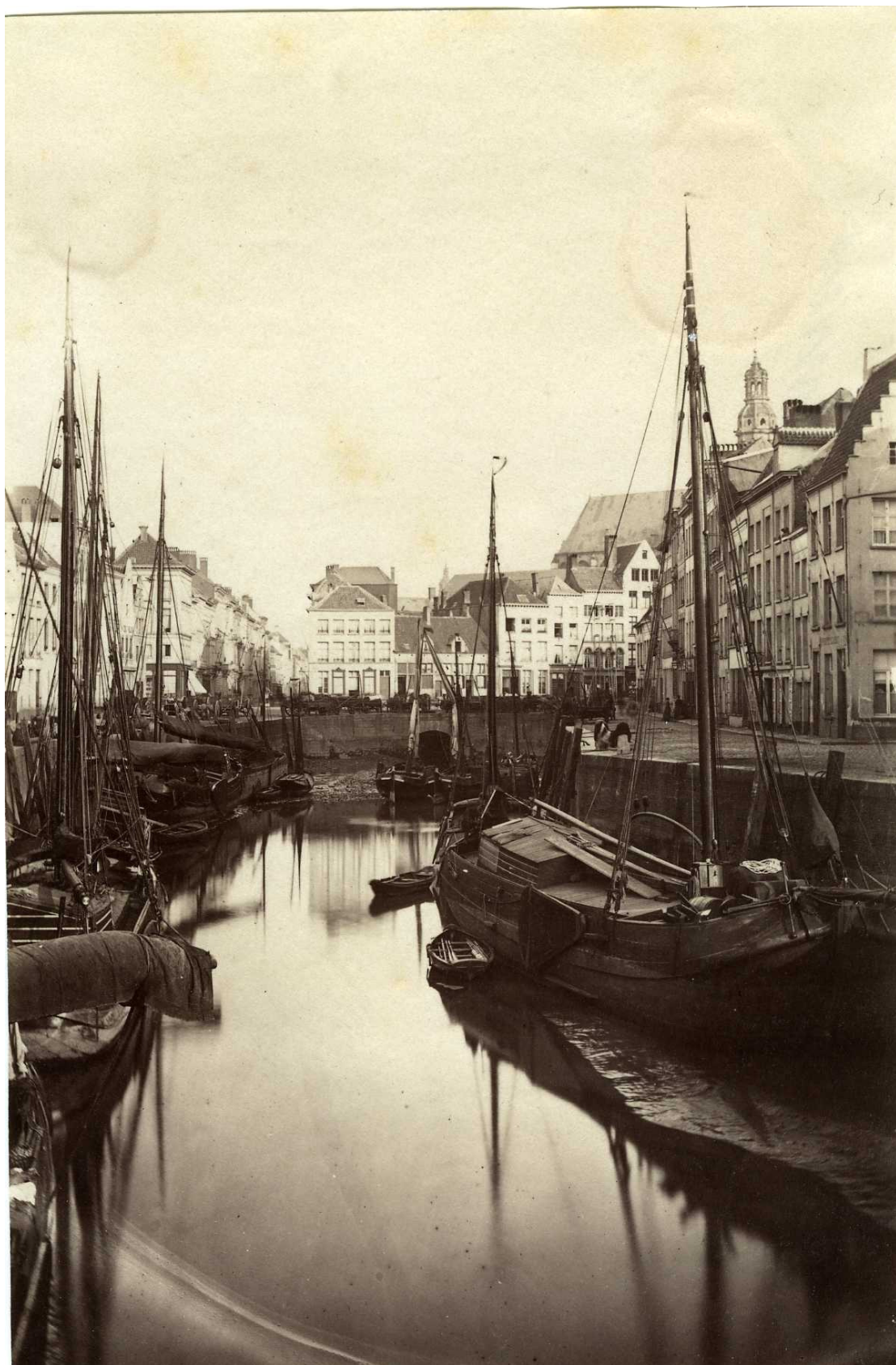
De Sint-Pietersvliet. Wellicht een opname van de Franse fotografen Léon & Lévy