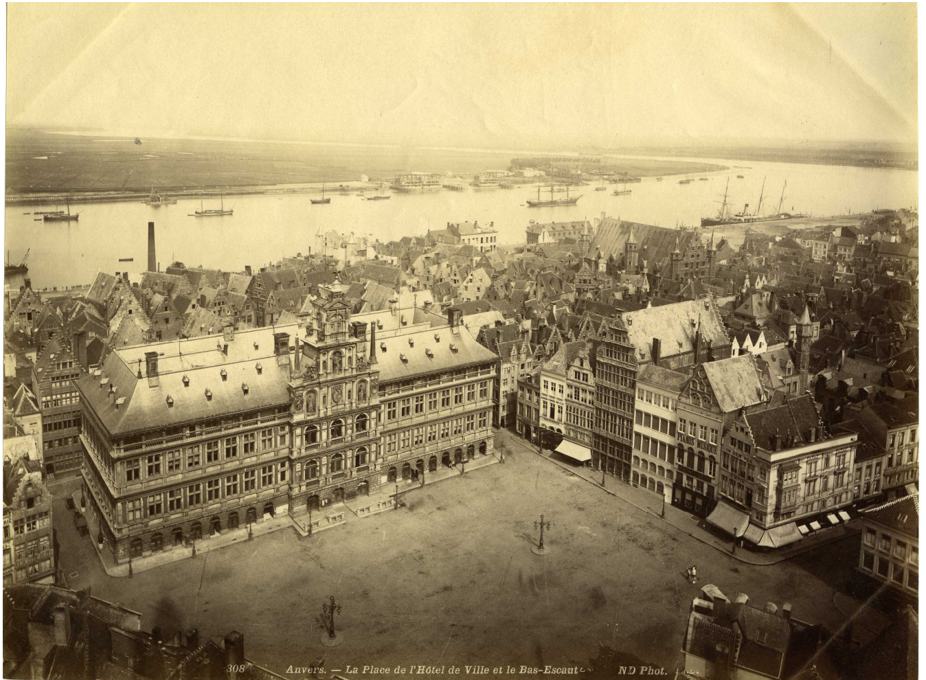
We kijken uit van op de kathedraal, rond 1883. Uiterst rechts zien we al een heraangelegde kade, en links daarvan de oude huizenblokken, vanaf het Sint-Walburgisplein tot aan het Steen.